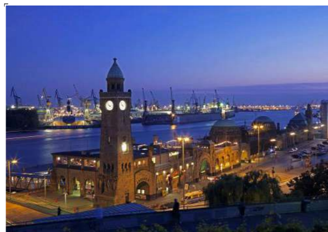
Hamburgo (Aeropuerto – 80 km)

La ubicación del campus es idílica: un estanque, el río Neetze, 45 hectáreas de bosque, caballos, taller de carpintería, atelier, un campo de deportes profesional son algunas de las características de nuestra institución.