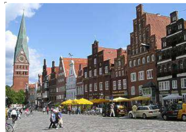
Lüneburgo (La ciudad más cercana - 20 km)

Para ir a Lüneburgo puedes tomar el autobús cerca del colegio y hacia Hamburgo hay trenes. También trabajamos de forma conjunta con una agencia de taxis.