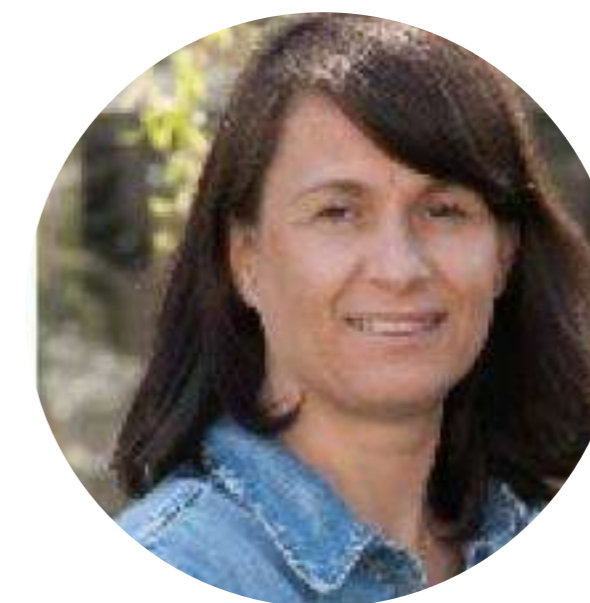
ORGANIZACION DE ACTIVIDADES DE TIEMPO LIBRE ASTRID GÜNTHER